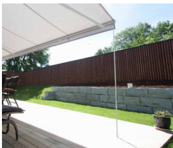
Markisen kan utstyres med støttestag for økt stabilitet i markisen

Armutfall i 210, 260, 310 og 360 cm. Maks bredde er 7 meter. Kan seriekobles opptil 15 meter med motor.