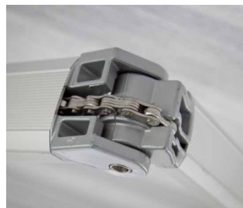
Norlux leveres med kraftige armer som er utstyrt med kjedetrekk.