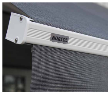
Markisen kan leveres i hvitlakkerte profiler (tillegg)