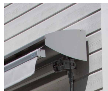
Overbrett anbefales for å beskytte duken når den ikke er i bruk