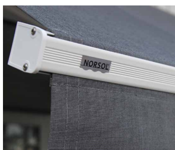
Markisen kan leveres i hvitlakkerte profiler (tillegg)