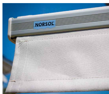
Rett markisekappe som standard